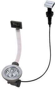
Vidange automatique LIRA 8407 102